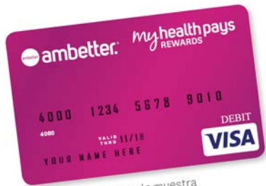
Tarjeta de muestra

¡Gane sus recompensas automáticamente en su Tarjeta Prepagada de My Health Pays™ Visa®!